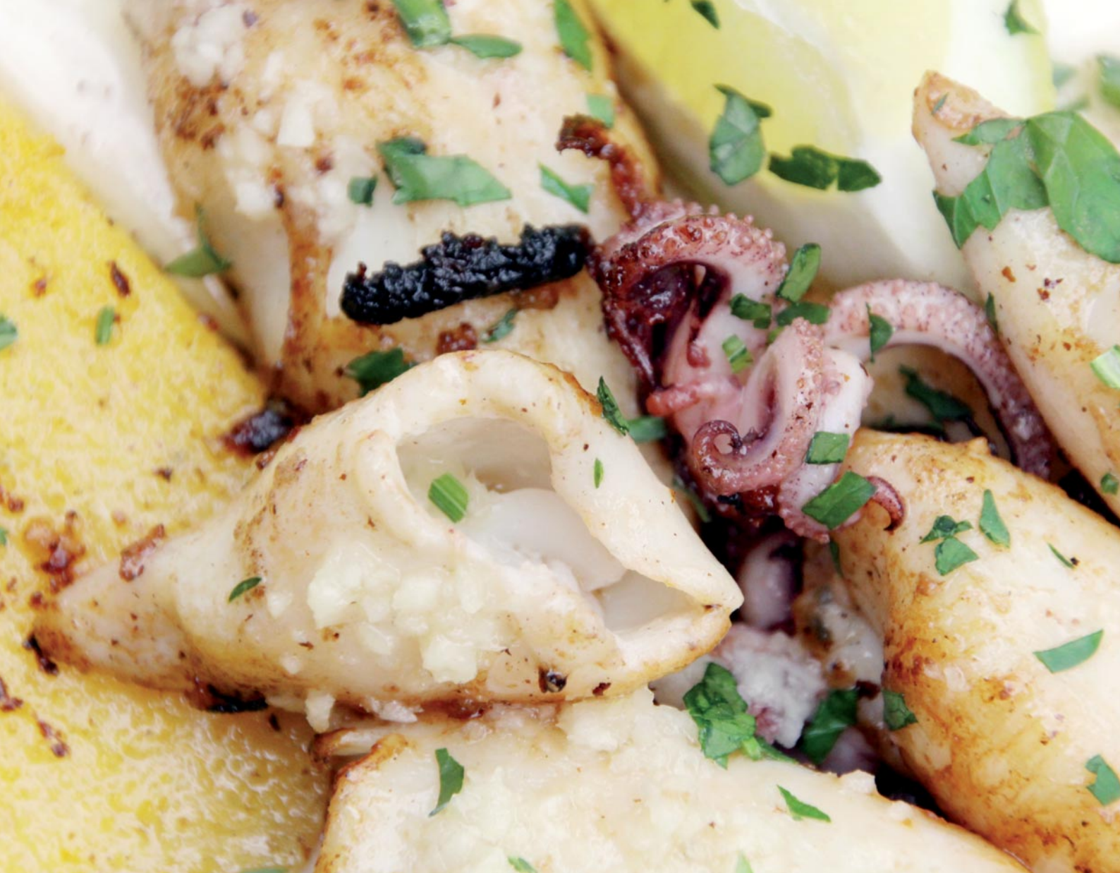
Abb. 3: Als faunistische Besonderheit sind die im Wörthersee-Dreieck nicht autochthonen Kalamari anzusehen.

gegeben werden. Die Verbindung der Institutionen rührt nicht zuletzt daher, dass in den Sammlungen des Landesmuseums durch Belege, Hinweise auf ehemalige, durch den von E.C.O. initiierten GEO-Tag aktuelle und durch naturschutzfachliche Planungen für den Erhalt bzw. eine Verbesserung der zukünftigen Biodiversität in den Fokus gerückt werden können.