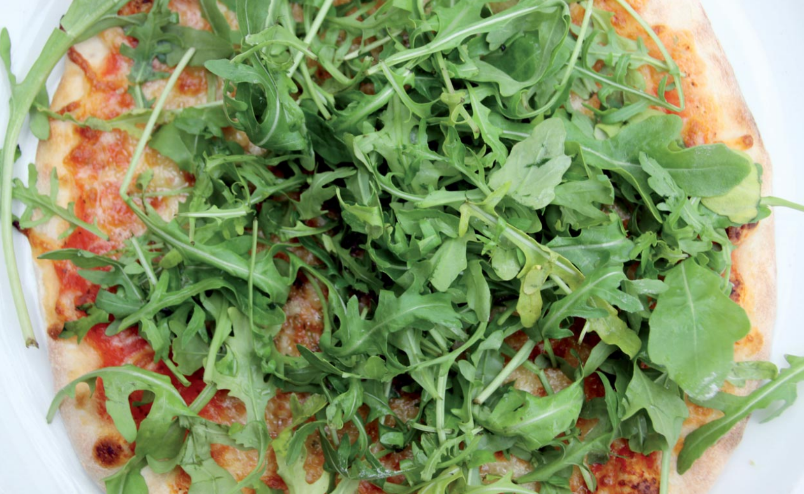
Abb. 4: Bei manchen Pizze treten die zoologischen Aspekte zumindest optisch in den Hintergrund.

Gewürzmischungen sowie Schnäpse und Liköre, wäre anzustreben. Die saisonal variierende Speisekarte lässt zudem zusätzlich weitere Arten erwarten. Für eine vertiefende Untersuchung von kulinarischer Biodiversität ist eine gute Kenntnis unterschiedlichster Artengruppen erforderlich. Deshalb könnte der Naturwissenschaftliche Verein für Kärnten mit seinen unterschiedlichen Fachgruppen bei einer Weiterführung der Bearbeitung wichtige Beiträge leisten. Dies würde im weiteren Sinn auch an die Arbeiten von LEUTE et al. (2000) anschließen.