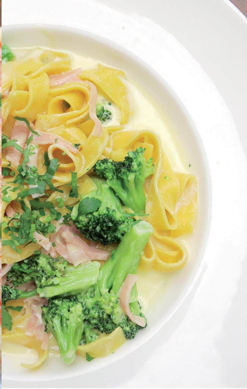
Abb. 2: Klassische italienische Pastagerichte beinhalten einen vielfältigen Mix aus pflanzlichen und tierischen Produkten.