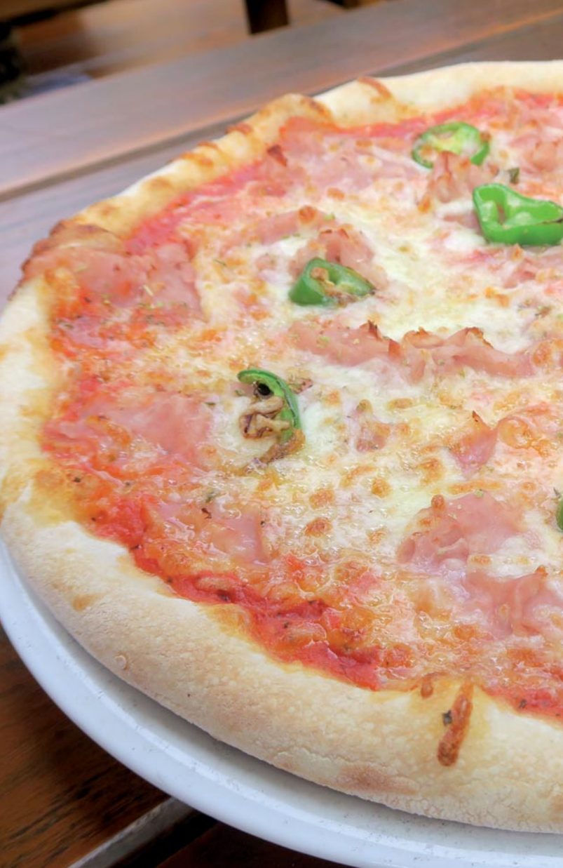
Abb. 1: Vor allem einige Pflanzenarten verleihen der Pizza Diabolo ihre charakteristische Würze.